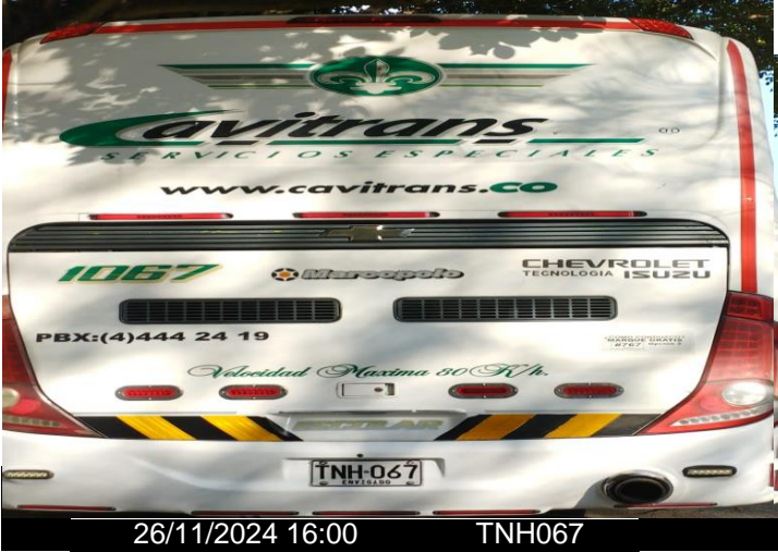
26/11/2024 16:00 TNH067