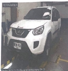
Fecha 2023-11-23 Placa WOW954 Hora 09:33