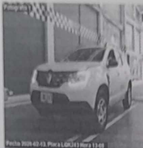
Fecha 2024-02-13, Plaza LQRJ11 Hora 13:40