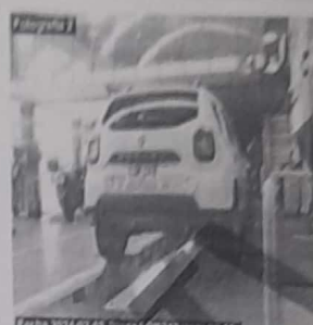
Fecha 2024-02-13, Plaza LQRJ11 Hora 13:41