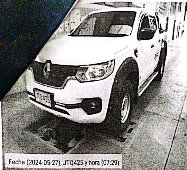
Fecha (2024-05-27), JTO425 y hora (07:29)