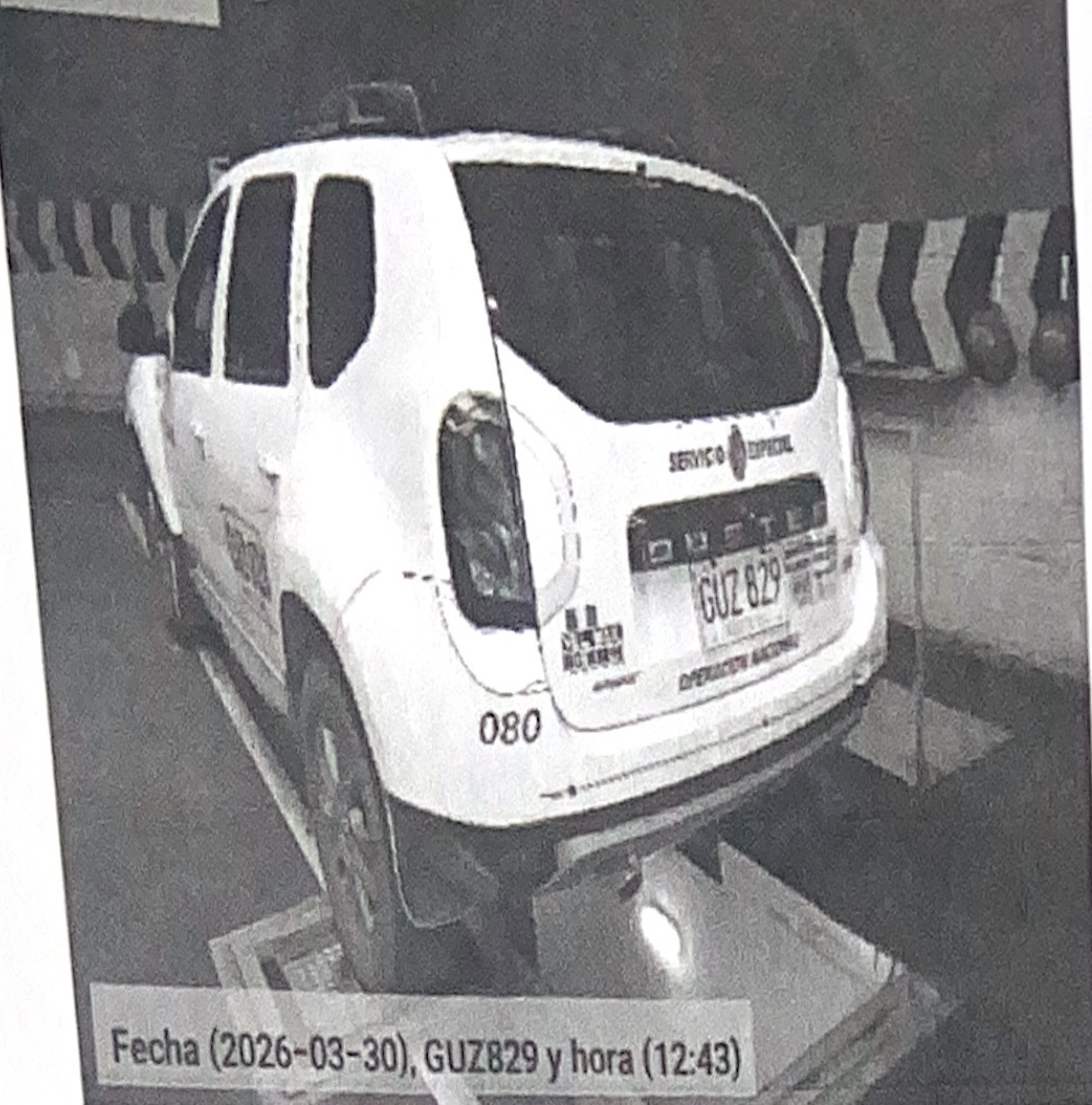
Fecha (2026-03-30), GUZ829 y hora (12:43)