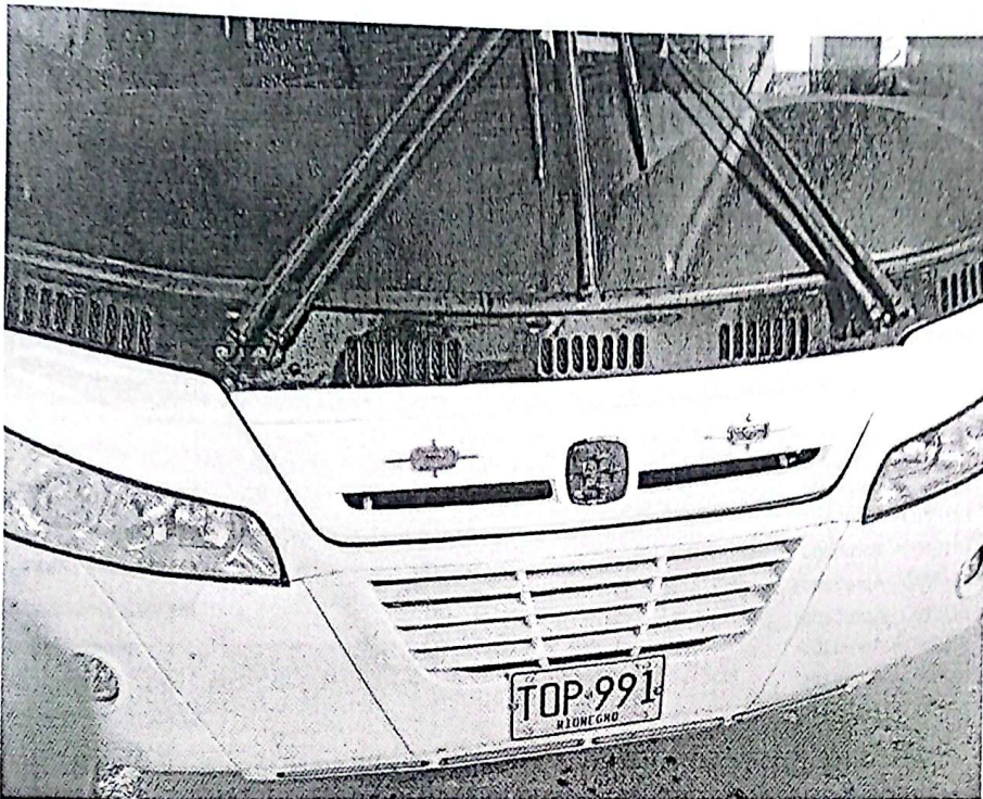
21/feb./2026 08:41 a.m. EUROLLANTAS-MARINILLA