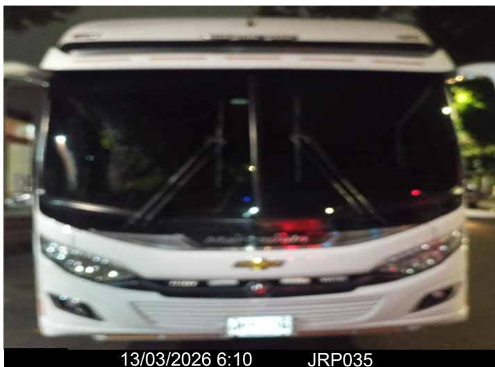
13/03/2026 6:10 JRP035

Visual -SEBASTIAN GOMEZFoto #1 -SEBASTIAN GOMEZ,Foto #2 -SEBASTIAN GOMEZ,