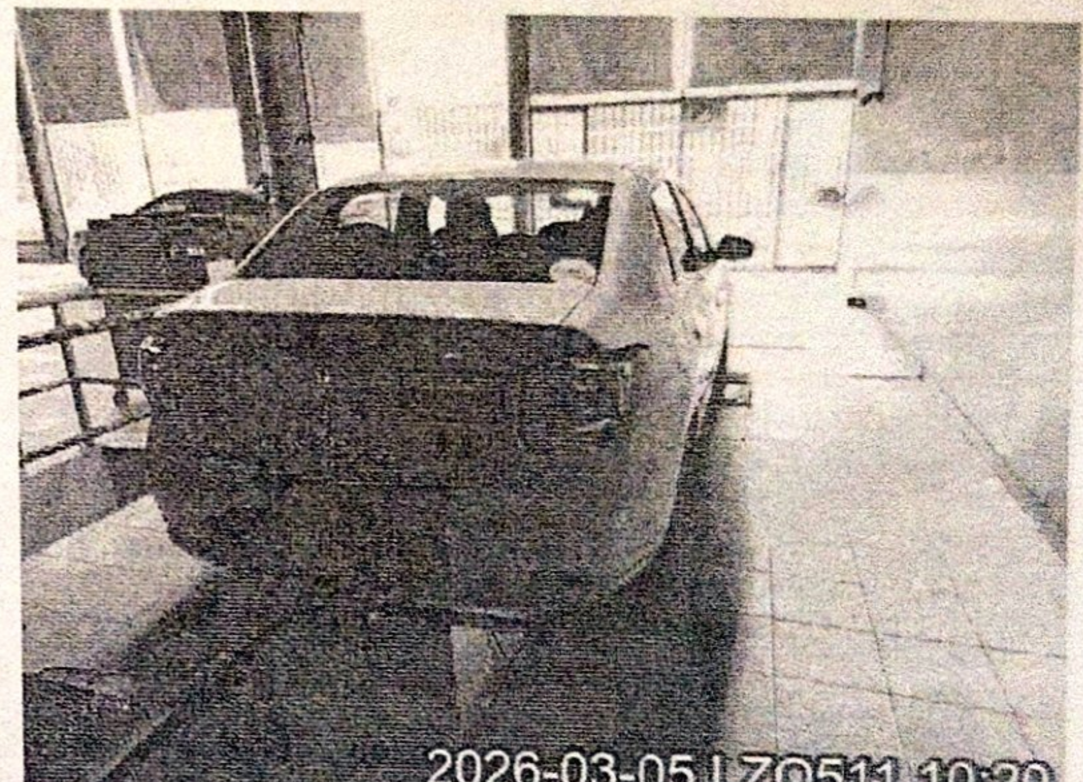
2026-03-05 LZO511 10:20