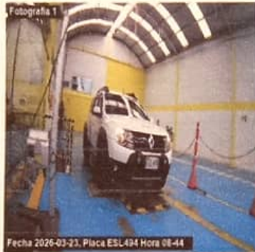
Fecha 2026-03-23, Placa ESL484 Hora 08:44