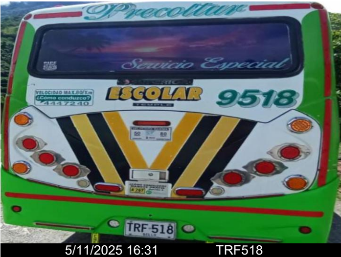
5/11/2025 16:31 TRF518