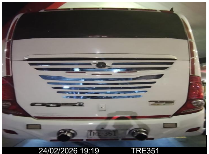
24/02/2026 19:19 TRE351