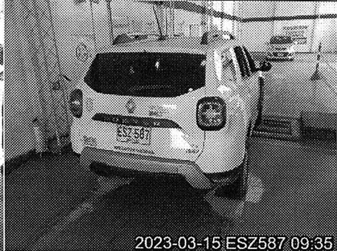
2023-03-15 ESZ587 09:35