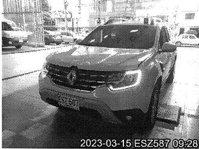
2023-03-15 ESZ587 09:28