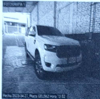
Fecha 2023-04-27, Placa GEJ562 Hora 12:32