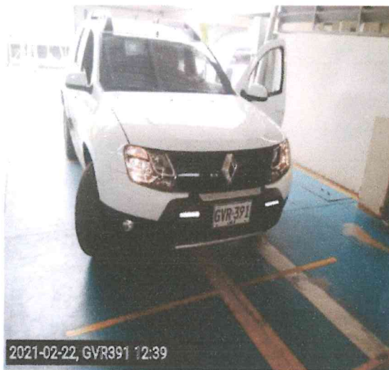
FOTO FRONTAL TRASERA