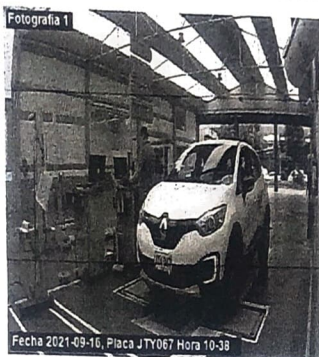
Fecha 2021-09-16, Placa JTY067 Hora 10:38