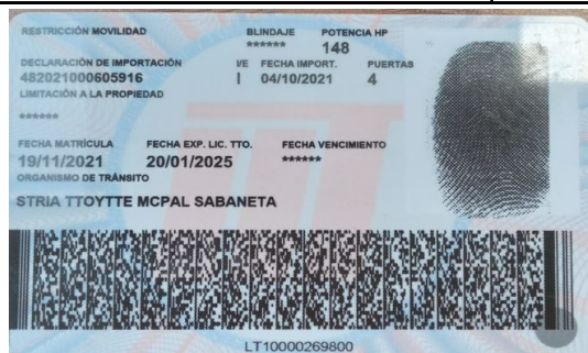
Imagen sin asignar