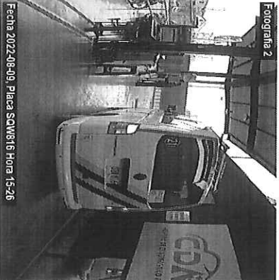
Fecha 2022-08-09, Placa SCW816 Hora 15:23