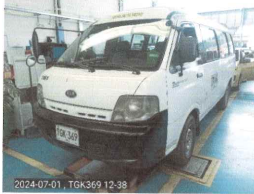
2024-07-01, TKG369 12-38