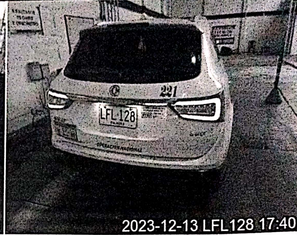
2023-12-13 LFL128 17:40