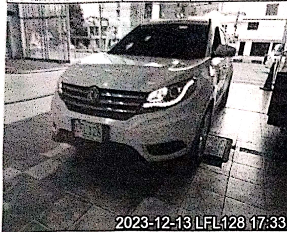
2023-12-13 LFL128 17:33