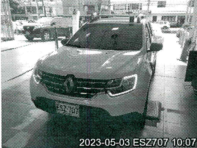
2023-05-03 ESZ707 10:07