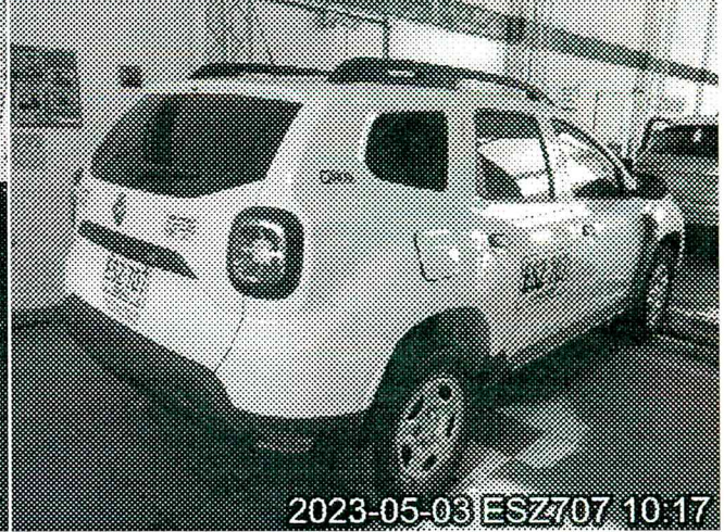
2023-05-03 ESZ707 10:17