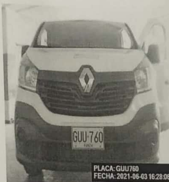
PLACA: GUU760 FECHA: 2021-06-03 16:28:06