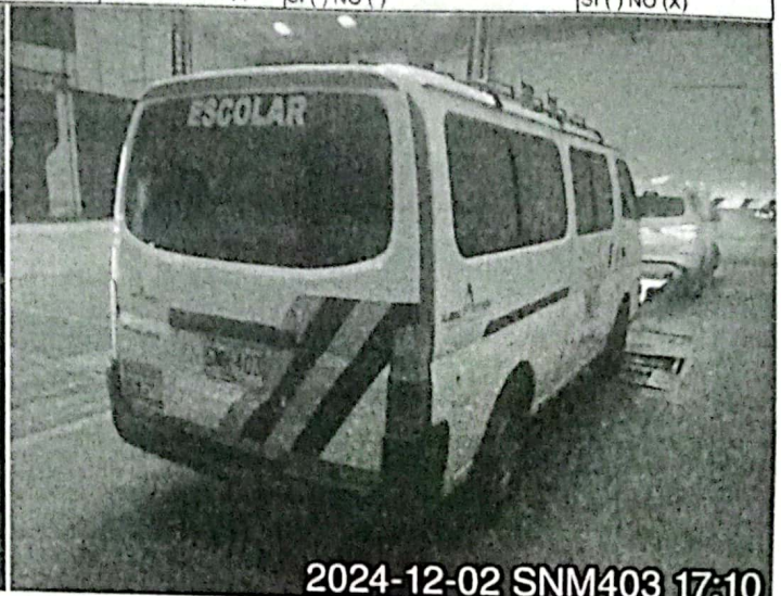
2024-12-02 SNM403 17:10