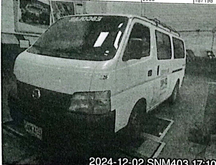
2024-12-02 SNM403 17:10