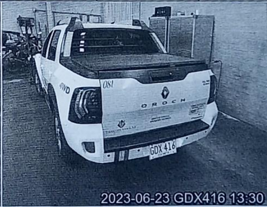
2023-06-23 GDX416 13:30