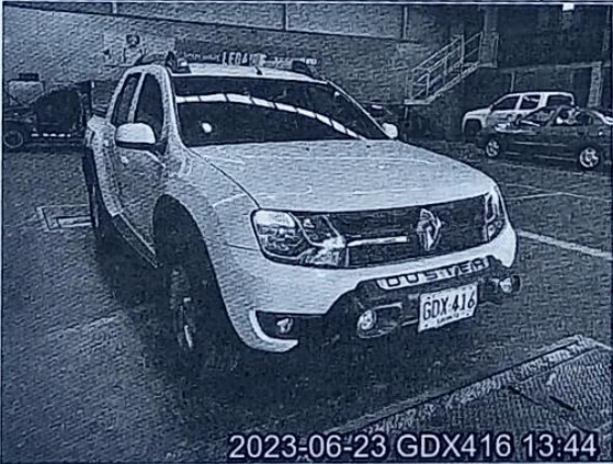
2023-06-23 GDX416 13:44