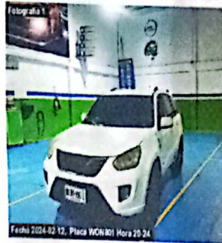
Fecha 2024-02-12, Placa WON801 Hora 20:24