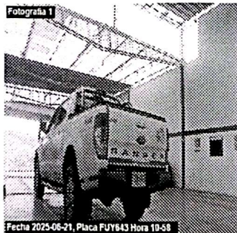
Fecha 2025-06-21, Placa FUY643 Hora 10:58