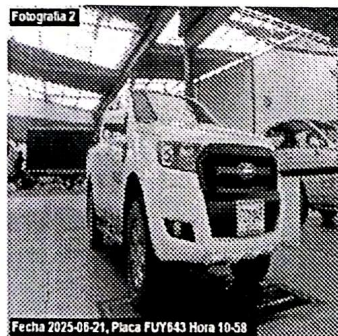
Fecha 2025-06-21, Placa FUY643 Hora 10:58