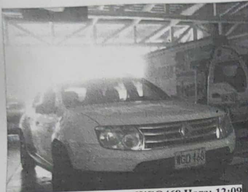
Fecha: 2023-09-10 Placa: WGO468 Hora: 12:09