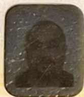
REGISTRADOR NACIONAL Alexander Vega Rocha