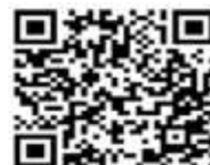
Escanee el código si desea verificar datos

CONSIDERACIONES LEGALES RELATIVAS A LOS EXAMENES DE INGRESO: Las Resoluciones 2346 del 11 de julio de 2007 y 1918 de Junio 5 de 2009 del Ministerio de la Protección Social (actualmente Ministerios de Trabajo y de Salud y Protección Social) reglamentan la práctica y contenido de las evaluaciones médicas ocupacionales de ingreso, con el objeto de determinar la existencia de restricciones para el trabajo a desempeñar, acorde con los requerimientos definidos por el empleador en el perfil del cargo. También establece que la Empresa solo puede conocer el CERTIFICADO MÉDICO DE INGRESO del aspirante. Los documentos completos de la Historia Clínica Ocupacional están sometidos a reserva profesional y quedan bajo nuestra guarda y custodia, según lo establecido en la Resolución 1918 de Junio 5 de 2009 y el trabajador puede obtener una copia de ellos cuando lo requiera, entendiendo que hacen parte integral de su historial médico.