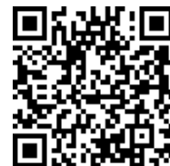
Escanee el código si desea verificar datos

CONSIDERACIONES LEGALES RELATIVAS A LOS EXAMENES DE CONTROL PERIODICO: Las Resoluciones 2346 del 11 de julio de 2007 y 1918 de Junio 5 de 2009 del Ministerio de la Protección Social (actualmente Ministerios de Trabajo y de Salud y Protección Social) reglamenta la practica de las evaluaciones médicas de control periódico con el objeto de monitorear la exposición a los factores de riesgo ocupacional e identificar posibles alteraciones temporales, permanentes o agravamiento del estado de salud del trabajador, ocasionadas por la labor o por el medio ambiente de trabajo, y para detectar precozmente enfermedades de origen común, con el fin de establecer un manejo preventivo. También establece que la Empresa solo puede conocer el CERTIFICADO MÉDICO DE CONTROL PERIODICO del aspirante. Los documentos completos de la Historia Clínica Ocupacional están sometidos a reserva profesional y quedan bajo nuestra guarda y custodia, acorde con lo establecido en la Resolución 1918 de Junio 5 de 2009 y el trabajador puede obtener una copia de ellos cuando lo requiera, entendiendo que hacen parte integral de su historial médico.