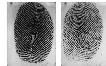
Huella Izquierda Huella Derecha HUELLAS OPTOMETRA

Usa Lentes Correctores: N Cirugia refr. diferente afaquia: N Visión Monocular: N Enfermedades Progresivas: N Trastornos Progresivos: N Afaquias: N Pseudofaquias: N Motilidad Palpebral: N Motilidad del globo ocular: N Fatiga Visual: N Ptois: N Lagofthalmias: N Diplopia: N Nistagmus que afecta cap. visual: N Nistagmus que origine fatiga: N Defectos de la visión binocular: N Estrabismos: N