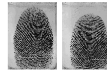
Huella Izquierda Huella Derecha