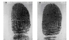
Huella Izquierda Huella Derecha HUELLAS FONOAUDIOLOGO