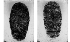
Huella Izquierda Huella Derecha HUELLAS PSICOLOGO