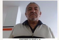
15/07/2022 11:10:42 a.m.