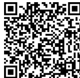
Escanee el código si desea verificar datos

CONSIDERACIONES LEGALES RELATIVAS A LOS EXAMENES DE INGRESO: Las Resoluciones 2346 del 11 de julio de 2007 y 1918 de Junio 5 de 2009 del Ministerio de la Protección Social (actualmente Ministerios de Trabajo y de Salud y Protección Social) reglamentan la práctica y contenido de las evaluaciones médicas ocupacionales de ingreso, con el objeto de determinar la existencia de restricciones para el trabajo a desempeñar, acorde con los requerimientos definidos por el empleador en el perfil del cargo. También establece que la Empresa solo puede conocer el CERTIFICADO MÉDICO DE INGRESO del aspirante. Los documentos completos de la Historia Clínica Ocupacional están sometidos a reserva profesional y quedan bajo nuestra guarda y custodia, según lo establecido en la Resolución 1918 de Junio 5 de 2009 y el trabajador puede obtener una copia de ellos cuando lo requiera, entendiendo que hacen parte integral de su historial médico.