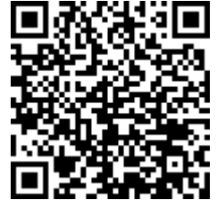
Escanee el código si desea verificar datos

CONSIDERACIONES LEGALES RELATIVAS A LOS EXAMENES DE CONTROL PERIODICO: Las Resoluciones 2346 del 11 de julio de 2007 y 1918 de Junio 5 de 2009 del Ministerio de la Protección Social (actualmente Ministerios de Trabajo y de Salud y Protección Social) reglamenta la practica de las evaluaciones médicas de control periódico con el objeto de monitorear la exposición a los factores de riesgo ocupacional e identificar posibles alteraciones temporales, permanentes o agravamiento del estado de salud del trabajador, ocasionadas por la labor o por el medio ambiente de trabajo, y para detectar precozmente enfermedades de origen común, con el fin de establecer un manejo preventivo. También establece que la Empresa solo puede conocer el CERTIFICADO MÉDICO DE CONTROL PERIODICO del aspirante. Los documentos completos de la Historia Clínica Ocupacional están sometidos a reserva profesional y quedan bajo nuestra guarda y custodia, acorde con lo establecido en la Resolución 1918 de Junio 5 de 2009 y el trabajador puede obtener una copia de ellos cuando lo requiera, entendiendo que hacen parte integral de su historial médico.