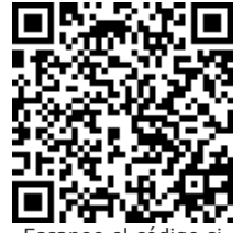
Escanee el código si desea verificar datos

CONSIDERACIONES LEGALES RELATIVAS A LOS EXAMENES DE INGRESO: Las Resoluciones 2346 del 11 de julio de 2007 y 1918 de Junio 5 de 2009 del Ministerio de la Protección Social (actualmente Ministerios de Trabajo y de Salud y Protección Social) reglamentan la práctica y contenido de las evaluaciones médicas ocupacionales de ingreso, con el objeto de determinar la existencia de restricciones para el trabajo a desempeñar, acorde con los requerimientos definidos por el empleador en el perfil del cargo. También establece que la Empresa solo puede conocer el CERTIFICADO MÉDICO DE INGRESO del aspirante. Los documentos completos de la Historia Clínica Ocupacional están sometidos a reserva profesional y quedan bajo nuestra guarda y custodia, según lo establecido en la Resolución 1918 de Junio 5 de 2009 y el trabajador puede obtener una copia de ellos cuando lo requiera, entendiendo que hacen parte integral de su historial médico.