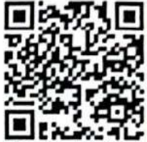
Escanee el código si desea verificar datos

Calle 17 norte No. 9-85 Barrio Antonio Nariño Popayán - Colombia preventsalud.co info@preventsalud.co