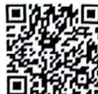
Escanee el código si desea verificar datos

CONSIDERACIONES LEGALES RELATIVAS A LOS EXAMENES DE INGRESO: Las Resoluciones 2346 del 11 de julio de 2007 y 1918 de Junio 5 de 2009 del Ministerio de la Protección Social (actualmente Ministerios de Trabajo y de Salud y Protección Social) reglamentan la práctica y contenido de las evaluaciones médicas ocupacionales de ingreso, con el objeto de determinar la existencia de restricciones para el trabajo a desempeñar, acorde con los requerimientos definidos por el empleador en el perfil del cargo. También establece que la Empresa solo puede conocer el CERTIFICADO MÉDICO DE INGRESO del aspirante. Los documentos completos de la Historia Clínica Ocupacional están sometidos a reserva profesional y quedan bajo nuestra guarda y custodia, según lo establecido en la Resolución 1918 de Junio 5 de 2009 y el trabajador puede obtener una copia de ellos cuando lo requiera, entendiendo que hacen parte integral de su historial médico.