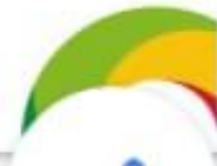
Gestión de Talentos Coordinadora de compensación y nómina CONINSA RAMÓN H S.A.