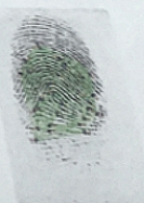
Indice derecho 2021-01-20

NOTA: Se sugiere realizar cada 360 días calendario para el plan Estratégico de seguridad vial.