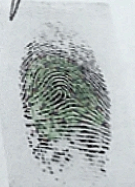
Indice izquierdo 2021-01-20