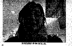
31/07/2021 8:44:23 A.M.